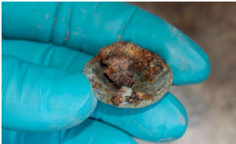
Figur 4. Undersidan av Birkaflickans rundspänne i C. Hedenstierna -Jonsons hand under utgrävningen sommaren 2011.

halsband med 6 silverfoliepärlor. I fyllningen låg även en kam av horn (Arbman 1940: typ taf.70:13, 1942:261f).