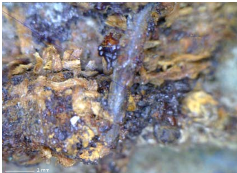
Figur 6. Mikroskopbild av textil på baksidan av spännet i grav Bj 948.