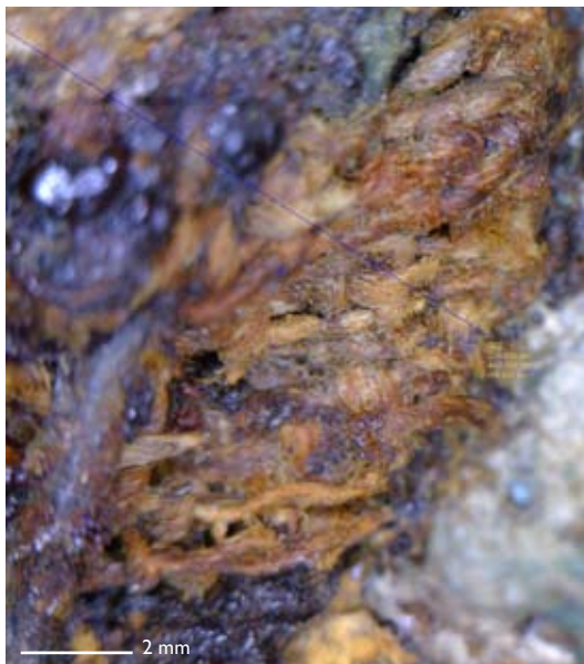
Figur 5. Mikroskopbild av textilier på baksidan av spännet i Bj 737A.