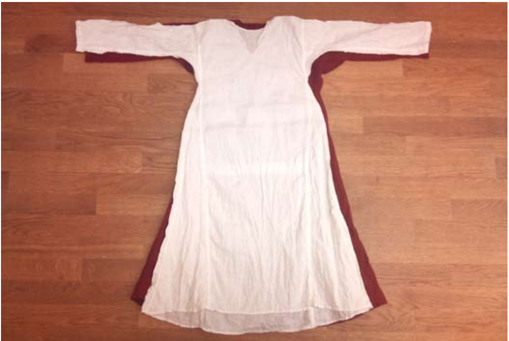
Figur 12. Den vita särken färdigsydd.