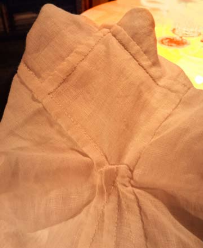
Figur 8. Fyrkantskilen fastsydd under ärmen på den vita särken.