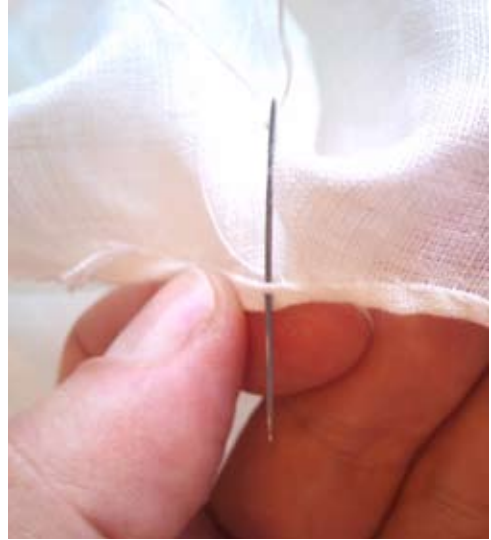
Figur 11. Kaststygn vid fällningen av halsringningen på den vita särken.