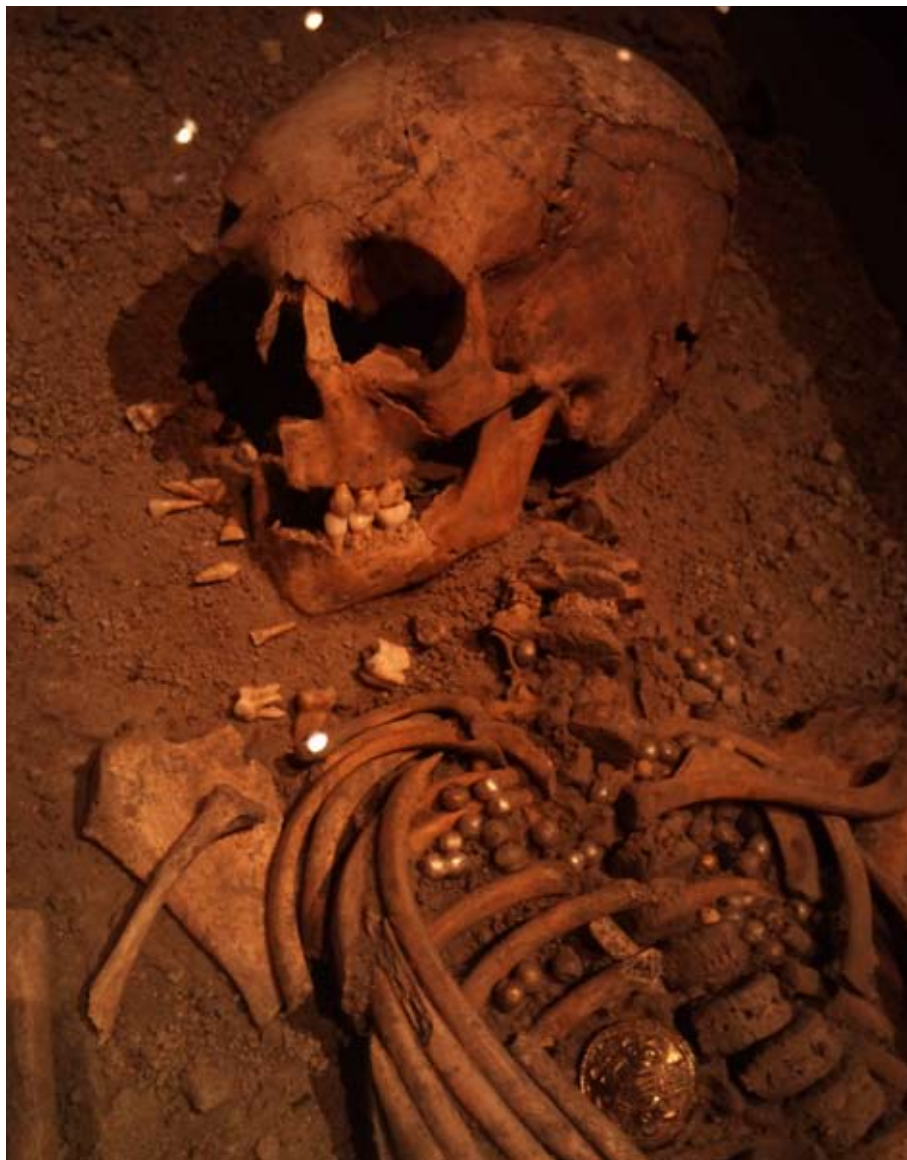
Figur 1. Birka flickan i sin grav efter att det skadade kraniet reparerats.

Förutom ett litet rundspänne placerat på bröstkorgen (figur 1) fick flickan med sig ett halsband bestående av silver- och guldfoliepärlor samt blå och gula glaspärlor, en kniv och ett nålhus av fågelben (Arbman 1943:131f; SHM 34000: