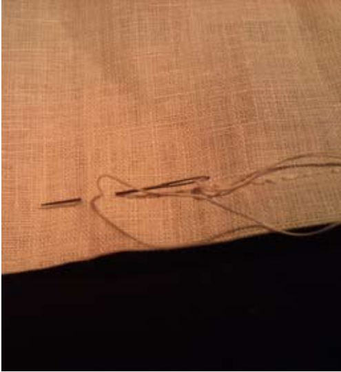
Figur 10. Efterstygn vid sidsöm eller falsksöm.