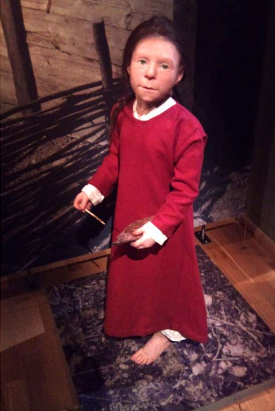
Figur 13. Birkaflickan med sina nya kläder i utställningen Vikingar på Historiska museet.