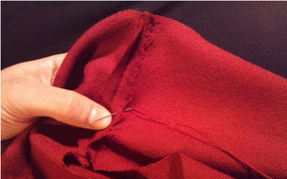
Figur 9. Nedsydd söm vid axeln.