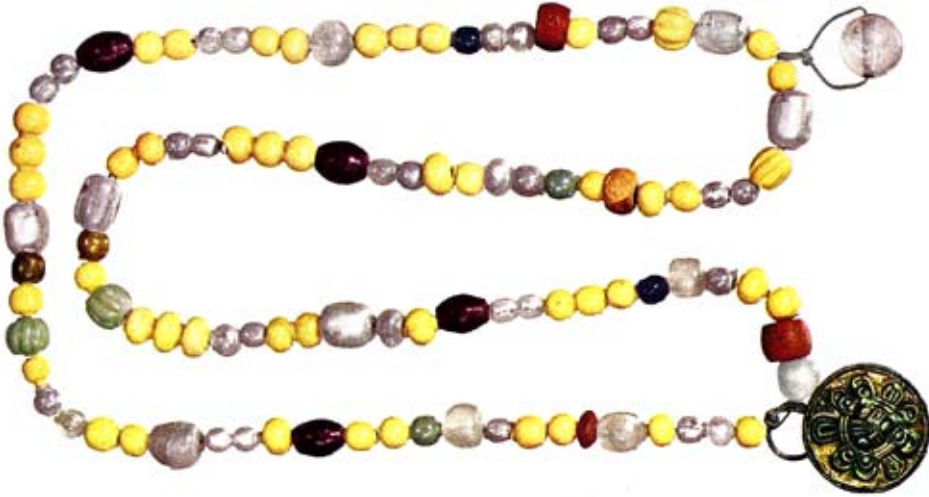
Figur 3. Halsband med rundspänne från barngrav Bj 948. Ur Arbman (1940, Taf. 124:2).

återigen i fyndmaterialet från tidig medeltid, nu baserade på olika kulörer som exempelvis röd botten med grön rand. Geijer iakttog emellertid att två vikingatida ulltextilbitar, i hennes grupp III – gravarna Bj 847 och Bj 1090 – var tvåfärgade med en randad blå och rödbrun varp med rödbrunt inslag (Geijer 1938:36; se även Andersson 2003:37).